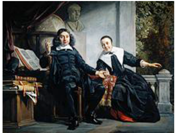
Abraham Casteleyn en zijn echtgenote Margarieta van Bancken (1663, Jan de Bray)

In het nummer van de OHC van 8 januari 1856 wordt stilgestaan bij de inmiddels 200 e verjaardag van de krant. Dat gebeurde middels de volgende tekst op de voorpagina: