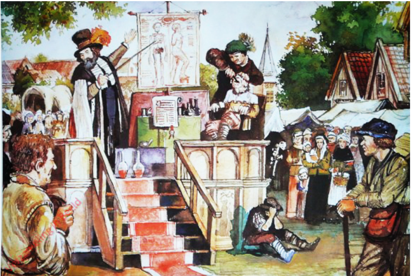
Kwakzalver en tandentrekker ca. 1650

t'Amsterdam ten Huysse Jaques Foubert op de Fluweele Burgwal op de Hoek van de Pieter Jacobstraet recht over 't Princen Hof is te bekomen: een Bloetstempend 1 Spiritus, by wytnementheyt goet voor 't Bloetspouwen, 't bloeden uyt de Neus, etc. waer van eenige weynige Droppelen aenstonts het selve doen ophouden; men kan het in en uytwendig gebruyken; het is ook seer dienstig voor alle Reysigers, en bysonder voor Officiers ter Zee en te Lant, die haer Wonden en Quetsuren soo haest in 3 Dagen daer mede genesen konnen, als door andere Medicamenten in een Maent; de Prijs is van 3 tot 6 Gl. de Boutelje: Ook een Bloetreyngend Elixir, seer dienstig om de Geelsucht, Scheurbuyck, Podagra en andere Gebreken van 't Bloet te remediëren, 't half Pint 6 Gl., etc.: Den oprechten Balsem van Siam, om de Swellingen en Pijn van de Podagra te verdrijven in seer korten tijt, à 2 Gl. 't Doosje: Een seer excellent Oogwater, om roode loop ende en swacke Oogen, oock allerhande Gebreken aen deselve te genesen, à 1 Gl. 't Flesje: Eyndelijck een Water, extraordinair voor Tantpijn, uyt wat oorsaeck die oock ontstaan mag, à 1 Gl. 't Flesje: Alles met de Onderrichting daer by, te bekomen by den Auteur, onlangs uyt Engelant gekomen, woonende als boven van goede Satisfactie sal geven, als mede in andere Saken, te lang om hier te insereren. (29 september 1711)